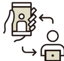
オンライン打合せ

迎賓館TOKIWAでは、新型コロナウイルス感染拡大を防止し、お客様ならびに職員の健康と安全管理のもと、「迎賓館TOKIWAガイドライン」を定めました。安心して準備期間や当日をお過ごしいただけるよう迎賓館TOKIWAスタッフ一同で感染拡大防止に取り組んでまいります。