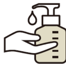
出勤・来館時の消毒