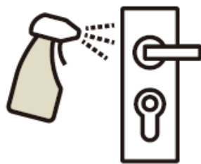
30分ごとの館内消毒